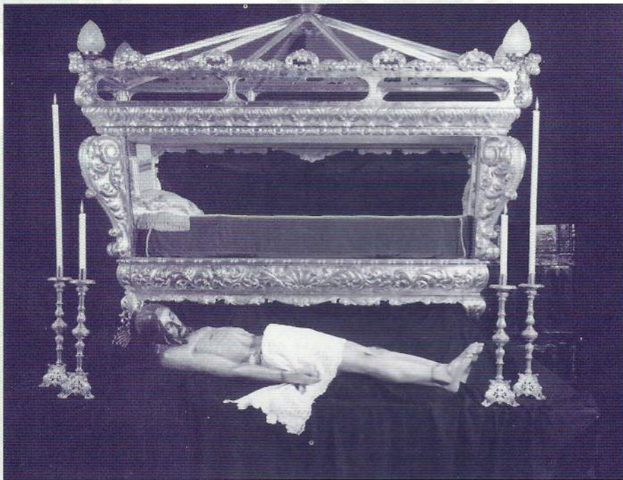
Idea y composición: josefe doblas corpas