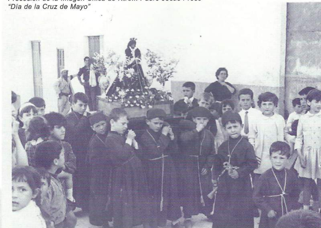
Procesión de la Imagen Chica de Ntro... Padre Jesús Preso "Día de la Cruz de Mayo"